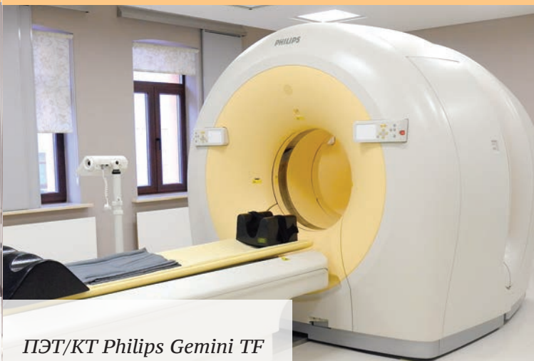
ПЭТ/КТ Philips Gemini TF

Формирование врачом-терапевтом индивидуального расширенного перечня диагностических исследований, включающего такие методы лучевой диагностики, как КТ, МРТ, ПЭТ/КТ, эндоскопические методы и т.д.