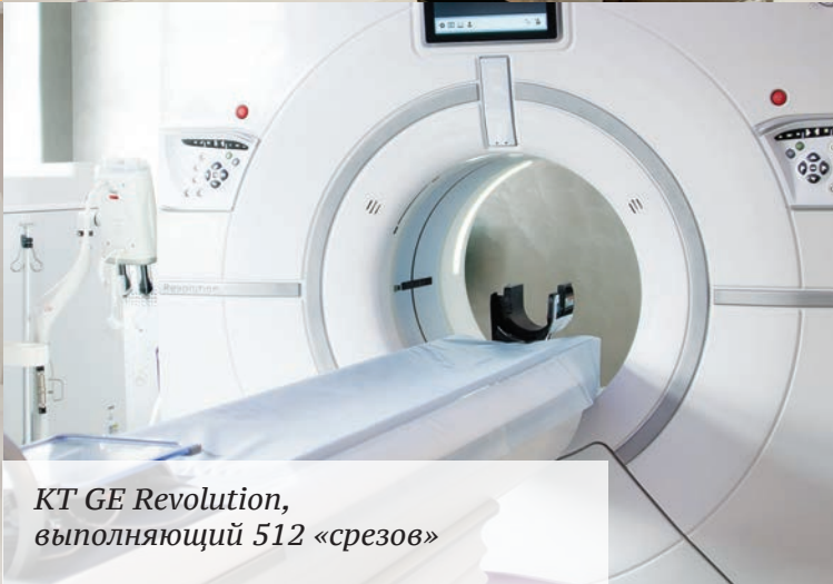
КТ GE Revolution, выполняющий 512 «срезов»