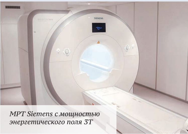
МРТ Siemens с мощностью энергетического поля 3Т

Цель программ, предлагаемых нашей клиникой – выявить заболевание на ранних стадиях.